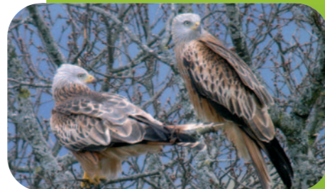
Milans royaux.