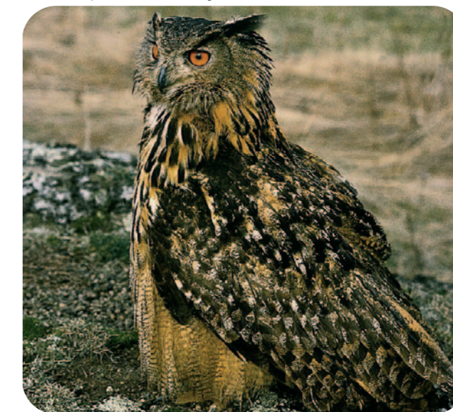
Grand duc d'Europe.

L'année 2006 a permis d'élaborer un programme de sorties découverte du patrimoine naturel des Gorges de la Loire. Ces balades nature guidées seront organisées courant 2007 ; le programme sera diffusé en début d'année.