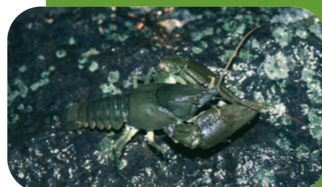
Écrevisse à pattes blanches.