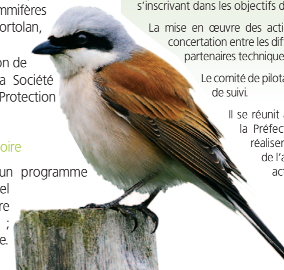
Pie Grièche écorcheur.

Il se réunit annuellement sous l'égide de la Préfecture de la Haute-Loire, pour réaliser le bilan technique et financier de l'année et la programmation des actions de l'année suivante.