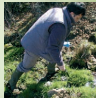
Prospections sur site

L'année 2007 va être prioritairement consacrée à la définition du projet.