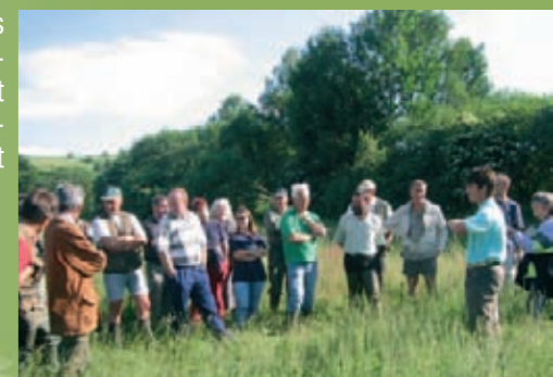
Présentation sur site par le CBNMC

Il permet l'expression des partenaires, la confrontation des points de vue et nécessairement la définition de compromis tout au long de la démarche.