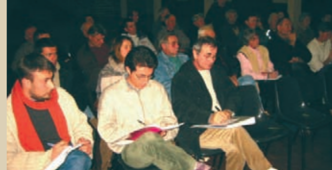
Présentation des études du Conservatoire botanique national du Massif Central.