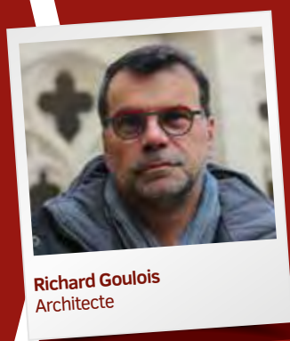
Richard Goulois Architecte