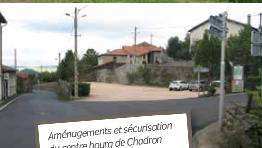
Aménagements et sécurisation du centre bourg de Chadron