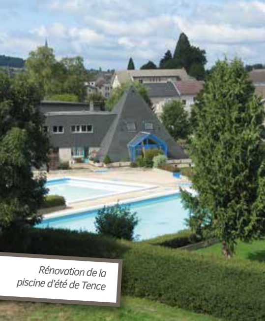
Rénovation de la piscine d'été de Tence